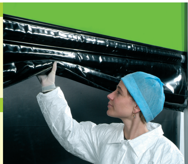
► Sicurezza: telo intelligente

Il motore ad azionamento diretto di comprovata affidabilità fornisce prestazioni di lunga durata. Questa tecnologia evita l'uso di catene e riduce la manutenzione. L'usura generale è ridotta poiché la porta funziona con solo 5 parti in movimento (motore, riduttore, fincorsa, albero di avvolgimento, cuscinetto).