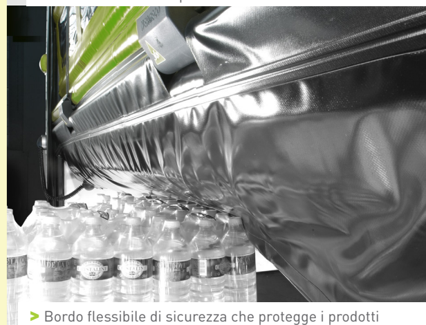
► Bordo flessibile di sicurezza che protegge i prodotti